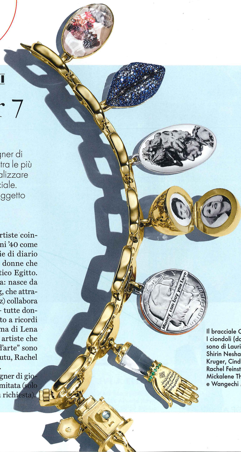
Il bracciale Charmed. I ciondoli (dal basso) sono di Laurie Simmons, Shirin Neshat, Barbara Kruger, Cindy Sherman, Rachel Feinstein, Mickalene Thomas e Wangechi Mutu.