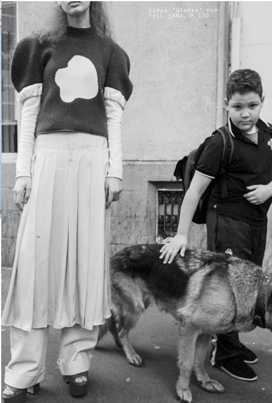
SÉRIE "UTOPIA" PAR TILL JANZ, P. 130

Dormir en Finlande sans jamais quitter Paris ? C'est le pari fou proposé par l'Institut culturel finlandais, qui installe six cabanes en bois ou "aitta", lieux d'évasion tant appréciés des locaux, au cœur de son adresse du 5 e arrondissement. Les fanatiques du design finlandais s'y précipiteront pour découvrir ces micro-maisons signées par la très réputée Linda Bergroth, les néophytes en profiteront pour s'initier à la chaleur simple de la vie made in Suomi. De janvier à mai 2017. Plus d'infos sur www.kotisleepover.com , réservations sur airbnb.com