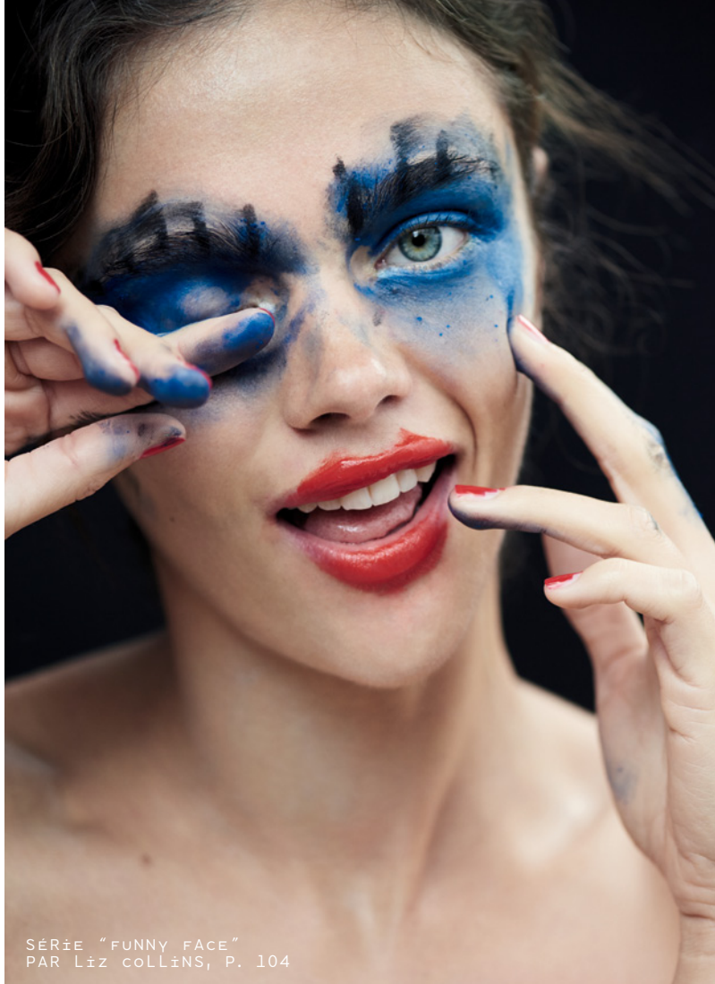
SÉRIE "FUNNY FACE" PAR LIZ COLLINS, P. 104